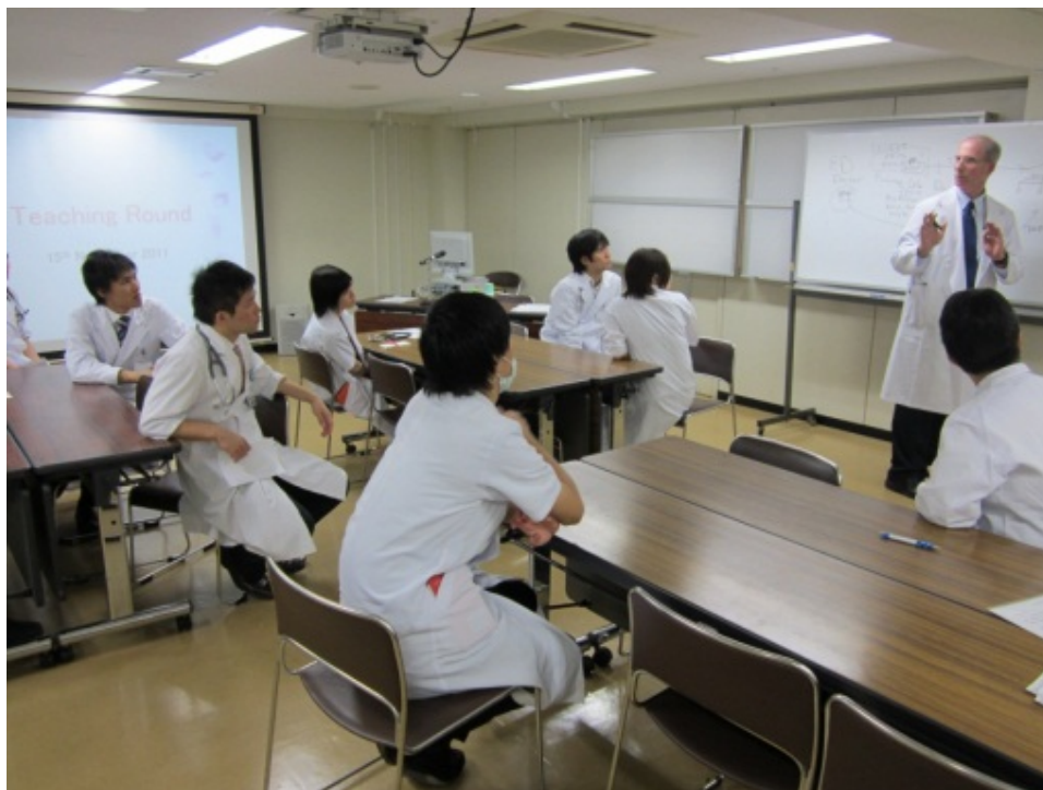
West Los Angeles Healthcare Center (veteran affairs Hospital) session