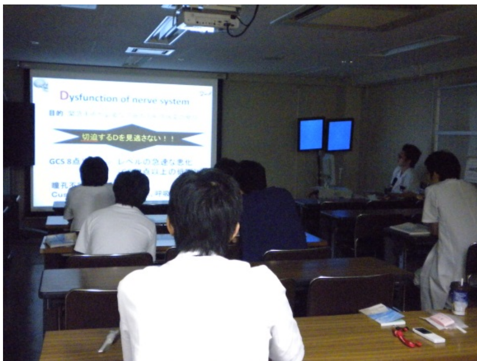
救急・総合診療内科合同勉強会